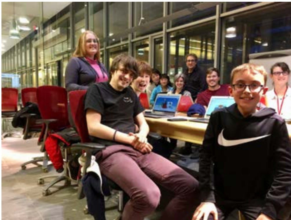
Tinkercad w Cambridge, Massachusetts

Czasem zdarza się, że moderatorki lub moderatorzy tworzą swoje własne kursy. Oto kilka przykładów: