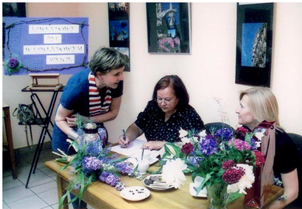
Spotkanie z autorkami „Lawendowego pyłu”