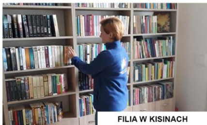
FILIA W KISINACH