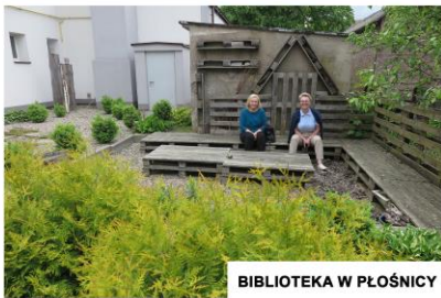
BIBLIOTEKA W PŁOŚNICY

Gminne Centrum Kultury i Biblioteka w Płońscy