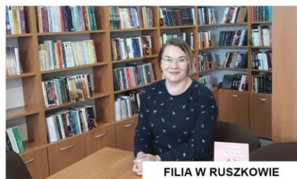
FILIA W RUSZKOWIE