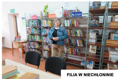
FILIA W NIECHŁONINIE