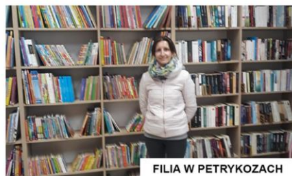
FILIA W PETRYKOZACH