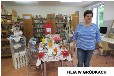
FILIA W GRÓDKACH