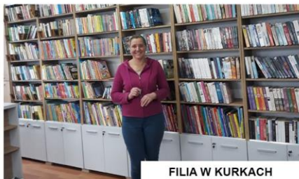
FILIA W KURKACH