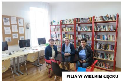
FILIA W WIELKIM ŁĘCKU