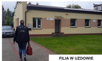
FILIA W UZDOWIE