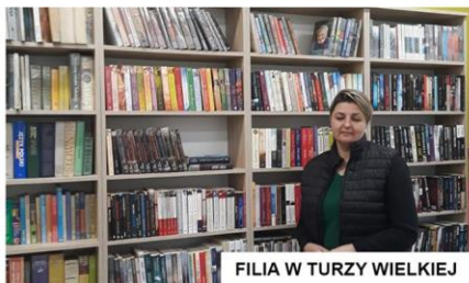
FILIA W TURZY WIELKIEJ