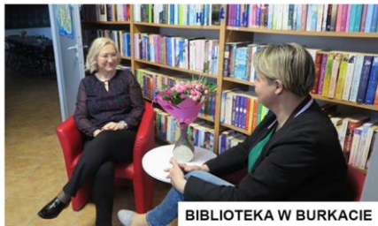
BIBLIOTEKA W BURKACIE