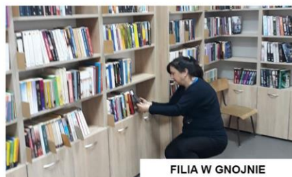
FILIA W GNOJNIE